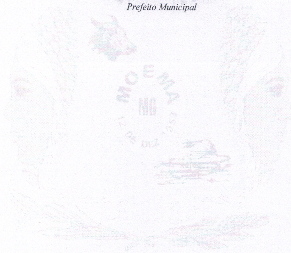
Alaelson Antonio de Oliveira Prefeito Municipal