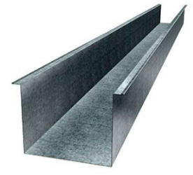
MODELO DE CALHA A SER UTILIZADO ESPECIFICADO NO PROJETO: Calha Galvanizada Tipo 1 DESENVOLVIMENTO/ MEDIDAS: CALHA QUADRADA DESENVOLVIMENTO DE 100, COM BASE DE 50CM