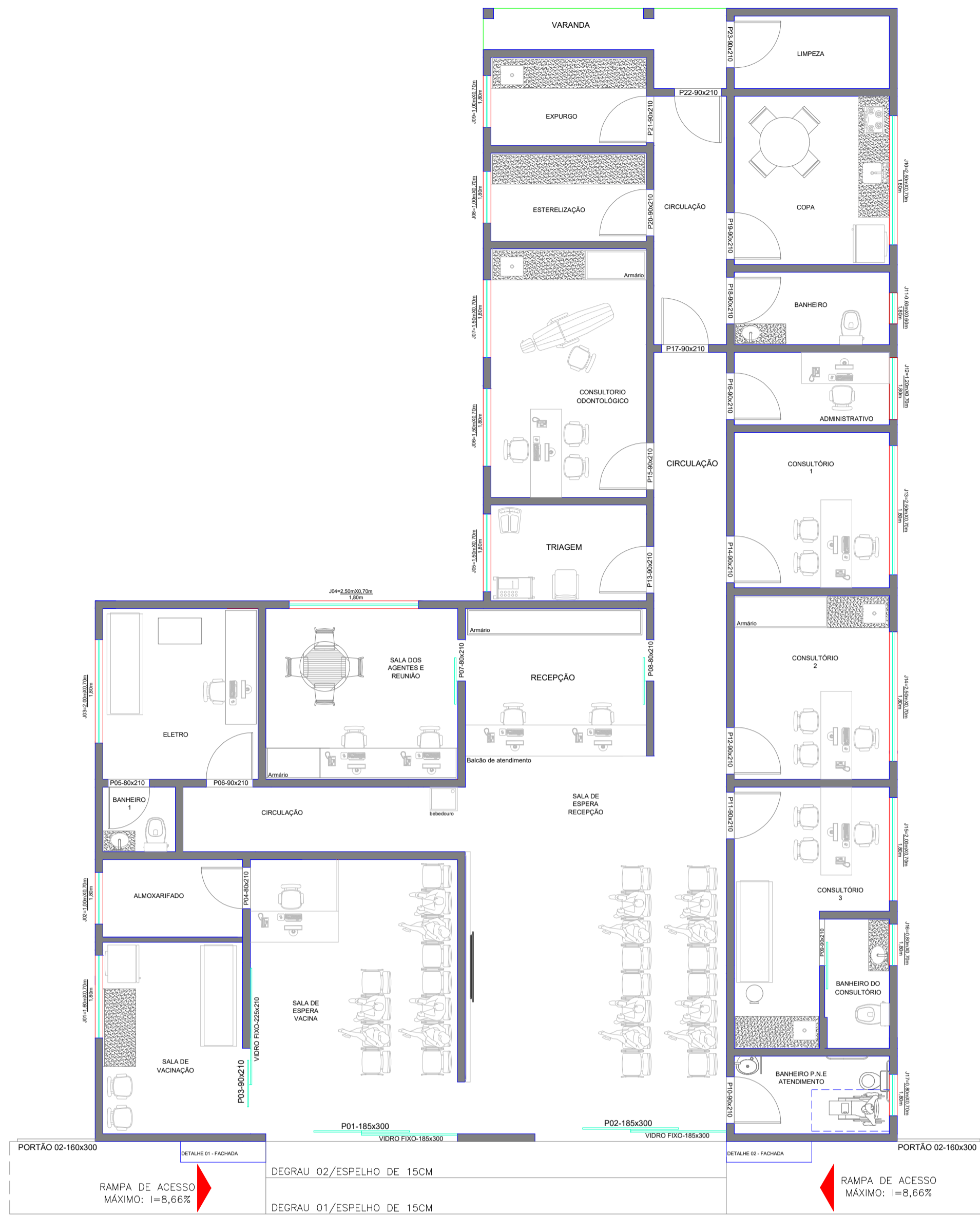
PLANTA BAIXA MOBILIADA E ESQUADRIAS ESC. 1:50